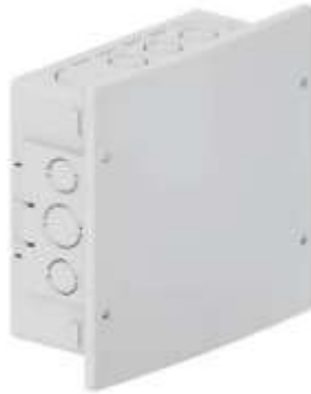
Figura 4 - Caixa de passagem PVC de embutir 200x200x100

Toda a infraestrutura será fixada por meio de abraçadeiras, suportes metálicos galvanizados e chumbadores adequados ao tipo de superfície (alvenaria, estrutura metálica ou laje). As eletrocalhas serão instaladas por fixação simples, com alinhamento adequado e suporte dimensionado conforme especificado em projeto.