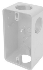
Figura 2: Condulete PVC 4x2" sobrepor

As caixas deverão garantir proteção mecânica e elétrica adequada, não sendo