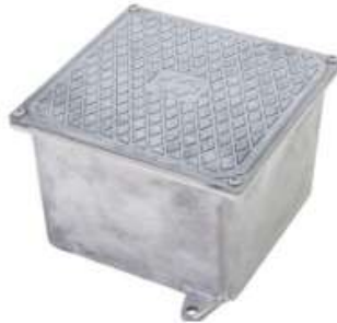
Figura 3 - Caixa de passagem alumínio de embutir 100x100x80mm

admitidas adaptações que comprometam a integridade da instalação.