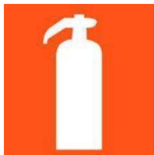
Figura 2 - Pictograma indicativo de extintor de incêndio