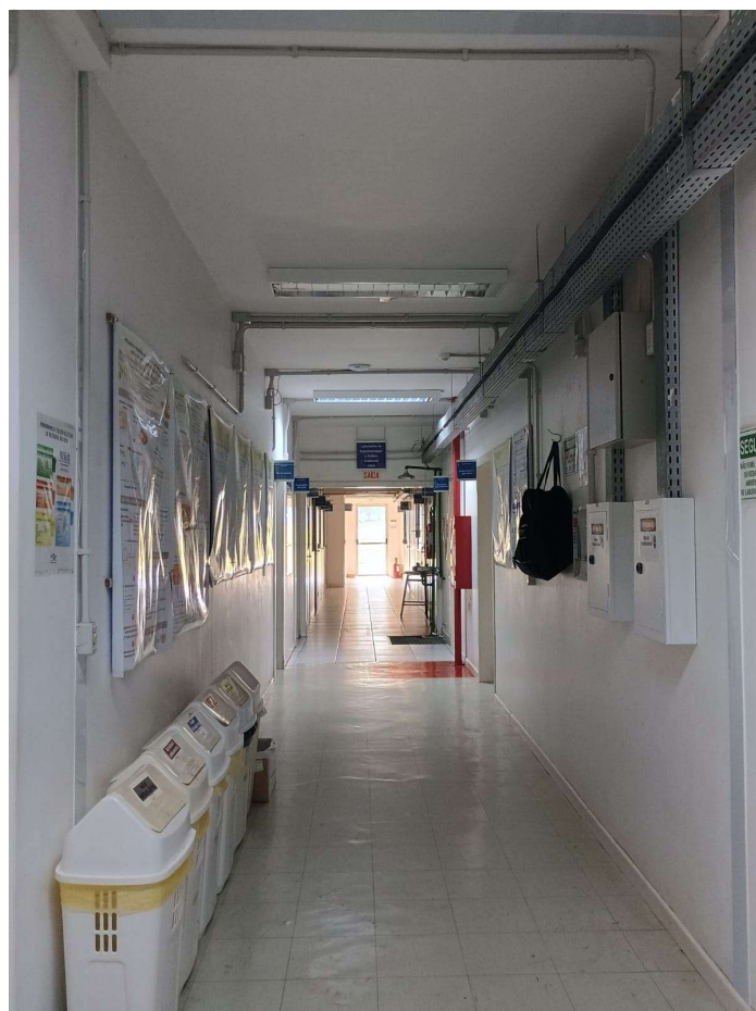
Figura 3 – Visão interna (Condições atuais do laboratório)