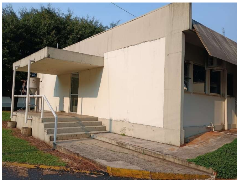
Figura 1 - Acesso frontal (Nova recepção)