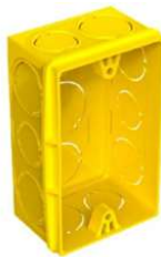
Figura 1: Caixa PVC 4x2" embutir

Serão utilizadas caixas de embutir em alvenaria ou laje, conforme indicado em projeto elétrico, bem como caixas condutes de PVC retangulares 4x2", aplicadas principalmente em instalações aparentes ou externas.