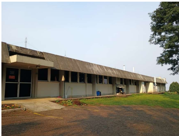
Figura 2 - Acesso lateral (Nova saída de emergência)